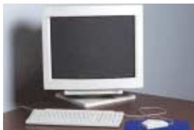
La fotografía es para fines de ilustración únicamente.

¡Todas las personas que llamen y dejen su nombre, dirección y número telefónico serán inscritas en nuestra Rifa de una Computadora que se efectuará en mayo de 2005!